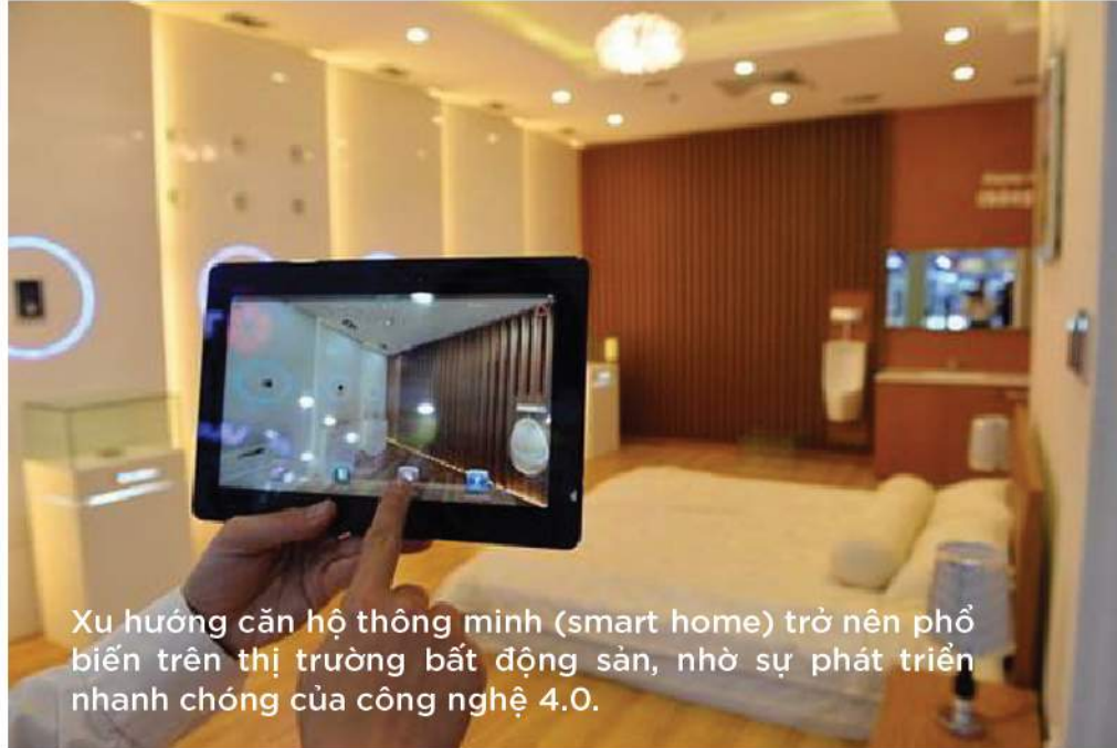
Xu hướng căn hộ thông minh (smart home) trở nên phổ biến trên thị trường bất động sản, nhờ sự phát triển nhanh chóng của công nghệ 4.0.