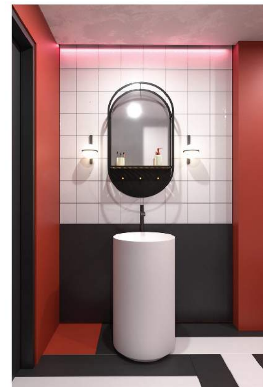
Gạch lát sàn hình chữ nhật màu đỏ, trắng và đen từ phòng ăn tạo ra một diện mạo khác trong phòng tắm.