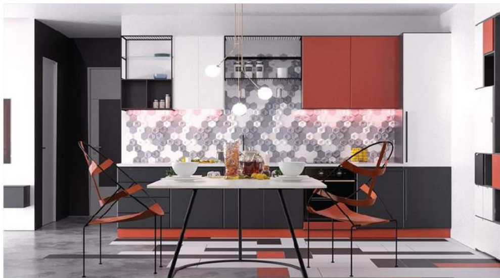
Ghế và bàn ăn hiện đại theo chủ đề hình tròn của căn nhà.

Tivi gắn vào tường cùng với bảng điều khiển nổi chạy bên dưới, xung quanh là kệ đứng và kệ ngang đặt đồ vật trang trí, cùng một bức tranh trừu tượng.