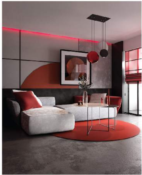
Chiếc đèn treo màu đỏ thẫm, vòng cung trên tường màu đỏ thẫm, vòng cung dưới sàn màu đỏ thẫm... như màu cờ Nhật Bản là dụng ý thiết kế của các kiến trúc sư.

Sự kết hợp giữa phong cách truyền thống của Nhật Bản và thiết kế hiện đại sẽ mang đến cho căn nhà của bạn diện mạo mới mẻ, ấn tượng.