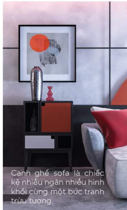
Cạnh ghế sofa là chiếc kệ nhiều ngăn nhiều hình khối cùng một bức tranh trừu tượng.